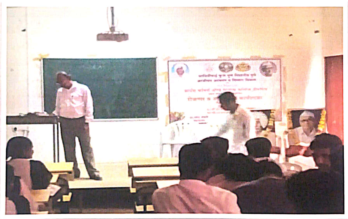
Employment and Entrepreneurship Workshop Photo