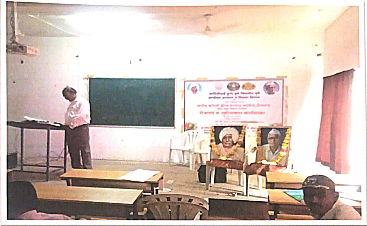
Employment and Entrepreneurship Workshop Photo